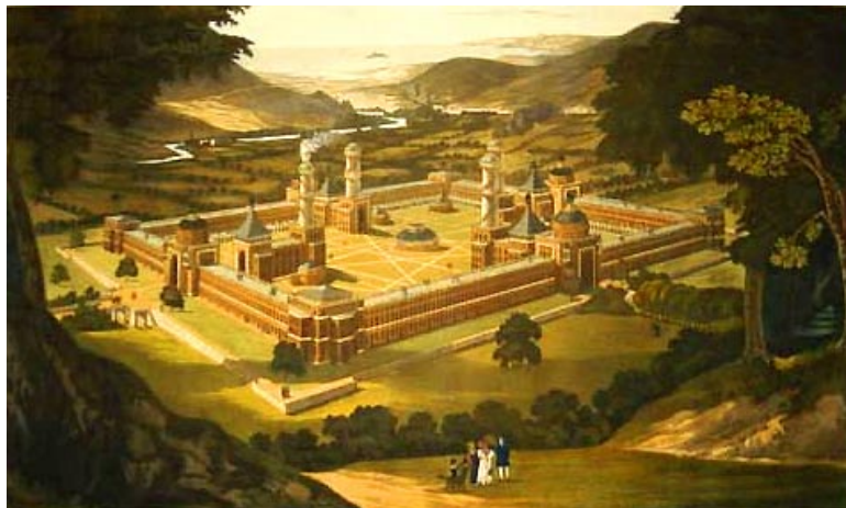
Slika 1: NEW HARMONY

Prijeten ogled filma in čimveč pravilno rešenih nalog vam želimo!