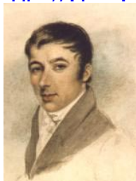
Slika 4: Robert Owen