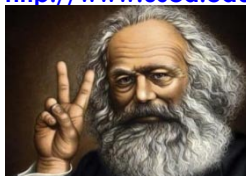
Slika 5: Karl Marx